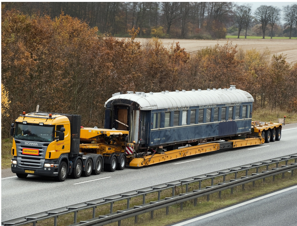
Vogn 3929 transporteres på blokvogn tilbage til Danmark.

Når erhvervelsen har været mulig, skyldes det, at Danmarks Jernbanemuseum har fået bevilget det nødvendige beløb til køb og hjemtransport af vognen fra Den A.P. Møllerske Støttefond, hvilket vi er meget taknemmelige for.