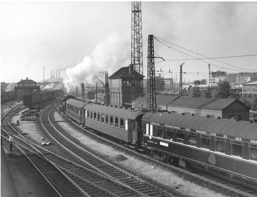
Vogn 3929 kører i Nord-expressen ud af København 1949.

Det fransk-belgiske sove- og spisevognsselskab Compagnie Internationale des Wagons-Lits, som fra 1883 til 1977 kørte Orient-expressen fra Paris til Balkan, stod også bag andre internationale tog, herunder Nord-expressen, som fra 1935 bl.a forbandt Paris og København. Forbindelsen blev afbrudt under 2. verdenskrig, men fra 1946 kørte de blå Wagons Lits-sovevogne igen, og nogle af vognene videreførtes efterhånden til Stockholm og Oslo. I 1949 opgraderedes kvaliteten af forbindelsen, idet Wagons-Lits anskaffede hele 29 nye sovevogne til trafikken på Scandinavien. Stykprisen svarede til 420.000 kr., så hele investeringen kom op på det svimlende beløb af 12 mio danske kroner.