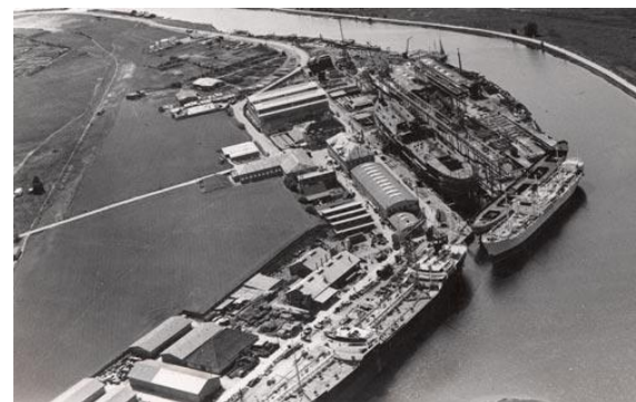
Odense Staalskibsværft ved Odense Kanal

Registrerings- og dokumentationsprojektet påbegyndes den 1. juni 2010 og projektkontoret på værftet åbnes fra den 14. juni 2010. Projektet forventes afsluttet ultimo 2011.