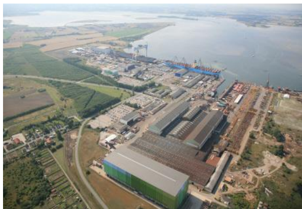
Lindøværftet blev indviet i 1959 på grund af behovet for at bygge større skibe

Den 10. august 2009 kom meddelelsen om, at Odense Staalskibsværft A/S endeligt afvikler skibsbygningsfunktionen på Lindøværftet i løbet af 2012. Et enestående dansk stykke industrikultur er dermed snart på vej til at blive historie.